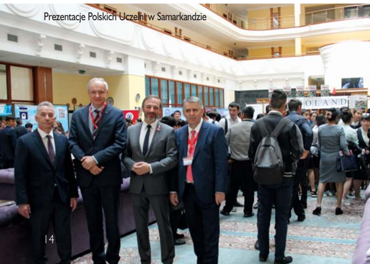
Prezentacje Polskich Uczelni w Samarkandzie

mi partnerami kilkanaście porozumień o współpracy.