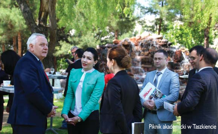
Piknik akademicki w Taszkencie