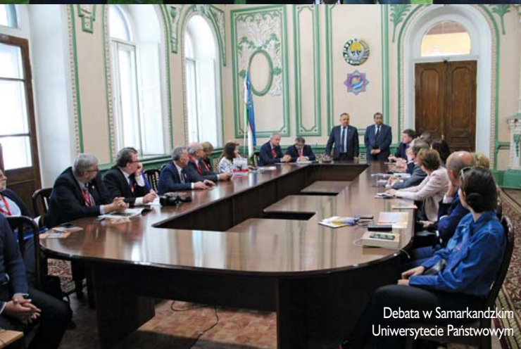
Debata w Samarkandzkim Uniwersytecie Państwowym