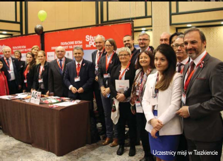
Uczestnicy misji w Taszkencie

Daje to gwarancję, że Klub Absolwentów Polskich Uczelni uroczycie zainaugurowany przez Ambasadę RP (wielkie brawa za tę inicjatywę!) w pierwszym dniu pobytu naszej misji edukacyjnej będzie miał w nadchodzących latach coraz więcej członków.