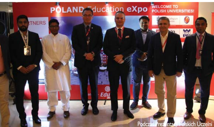
Podczas Prezentacji Polskich Uczelni

Wszystkim partnerom serdecznie dziękujemy za wspieranie działań „Study in Poland” w Indiach. Będziemy tu regularnie przyjeżdżać!